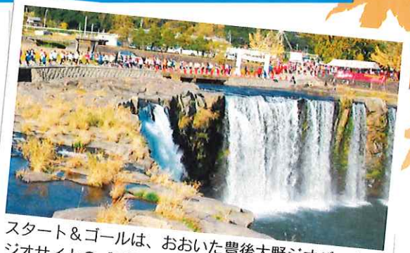
スタート&ゴールは、おおいた豊後大野ジオパーク・ジオサイトの「原尻の滝」の上となります。 【日本の滝百選】

いずれも保険料込みです。未就学児は保護者同伴により参加可能です。申込後は原則返金しませんのでご了承下さい。